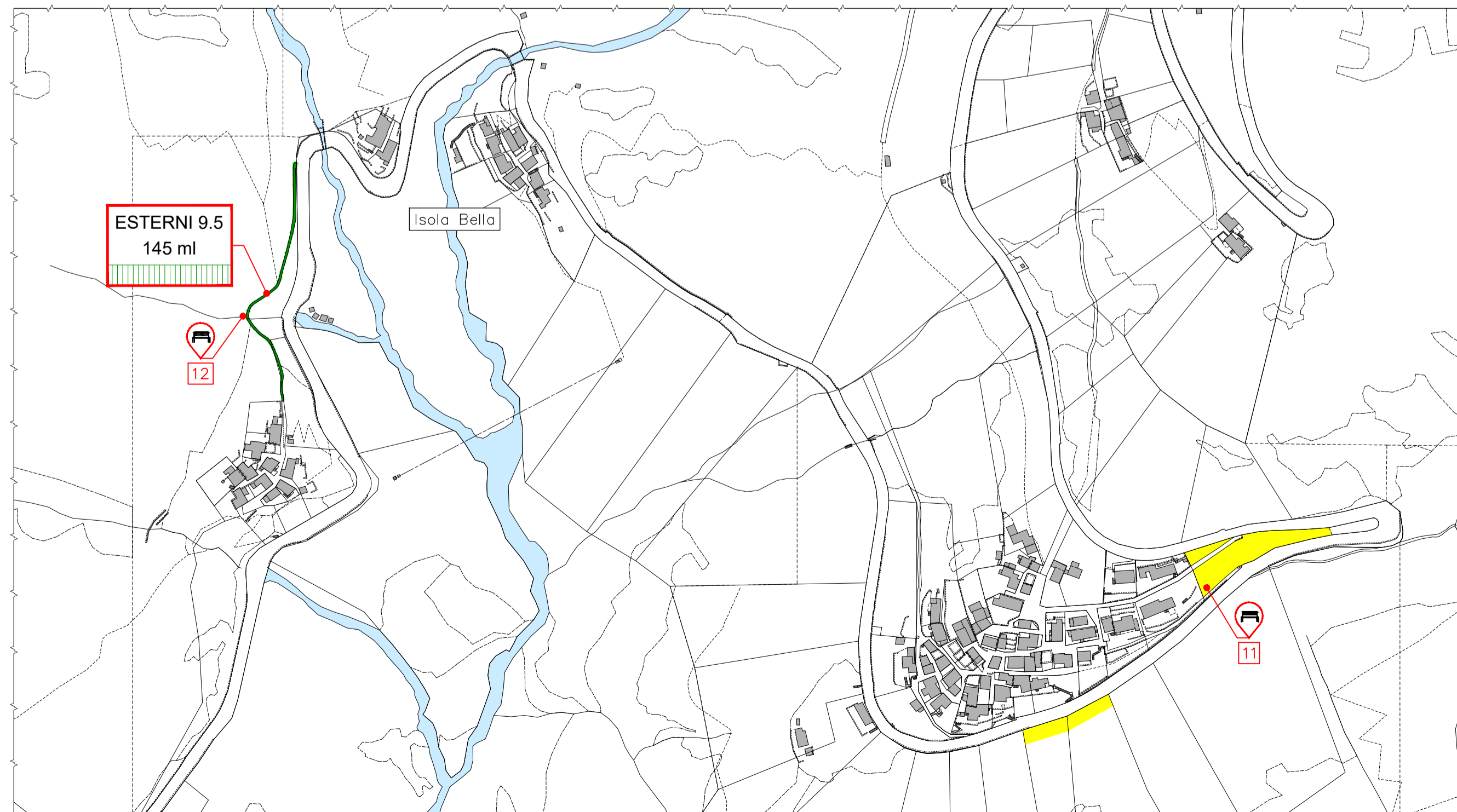
Planimetria di Indemini - Isola Bella e Daga scala 1:2'000