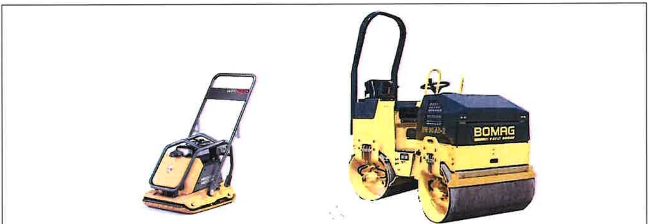
Esempi non esaustivi di piastra vibrante e rullo compattatore

Con gli interventi proposti i lavori di manutenzione si ridurranno in modo significativo. Gli interventi di ordinaria manutenzione potranno essere svolti con l'ausilio di piastra vibrante e solo saltuariamente - si stima ca. 2 volte per anno - tramite rullo compattatore.